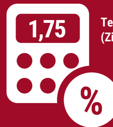
Technischer Zinssatz (Zins Deckungskapital Renten)