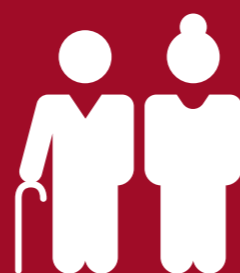
Rentenbezüger (Anzahl Renten)